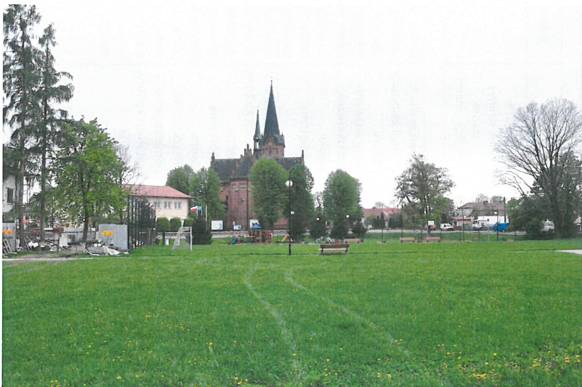
Centralny plac wsi Zaleszany.

Zaleszany sołectwem wspólnych inicjatyw organizacji pozarządowych oraz aktywnych grup nieformalnych, które wykorzystują swój potencjał do zapewnienia mieszkańcom bezpiecznych i godnych warunków życia. Infrastruktura społeczna, sportowa, rekreacyjna i techniczna są na wysokim poziomie i służą mieszkańcom oraz turystom do realizacji ich pasji i zainteresowań, a centrum wsi, jako główny ośrodek życia społeczności lokalnej jest miejscem kultywowania i podtrzymywania tradycji, krzewienia kultury i sportu.